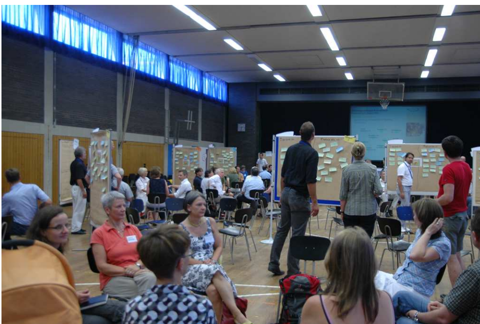
Abbildung 3: Erste Planungswerkstatt Konversion, August 2010