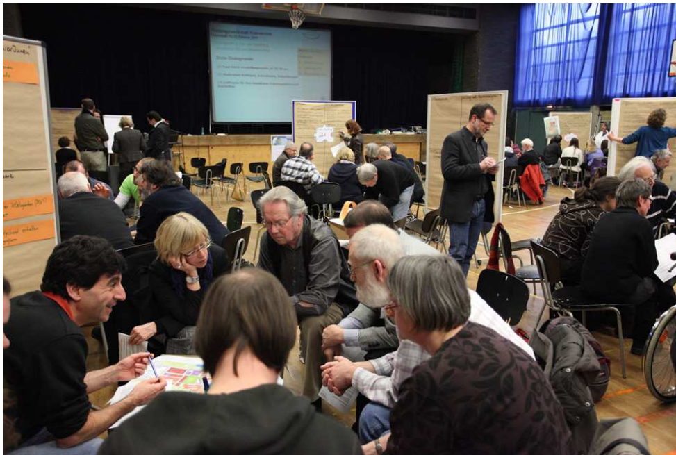
Abbildung 7: Zweite Planungswerkstatt, Februar 2011

Am 11. und 12.02.2011 haben wir eine zweite Planungswerkstatt veranstaltet. Wiederum haben über 200 Bürgerinnen und Bürger an 2 Tagen zunächst Informationen zur städtebaulichen und landschaftsplanerischen Rahmenplanung sowie zum Verkehrskonzept erhalten. Danach konnten sie Ihren Ideen freien Lauf lassen und die vorgestellten Inhalte bewerten.