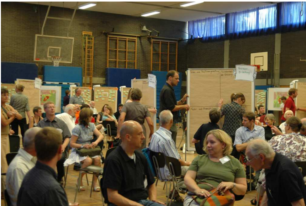
Abbildung 2: Erste Planungswerkstatt Konversion, August 2010

Ein weiterer wichtiger Schritt, die Öffentlichkeit in den Planungsprozess einzubeziehen, war die Durchführung einer 1. Planungswerkstatt Konversion im August 2010. Unter dem Motto „Gestaltet Eure Stadt“ sind über 200 interessierte Bürgerinnen und Bürger der Einladung nachgekommen. Damit waren sämtliche angebotenen Plätze ausgefüllt. Die Teilnehmenden diskutierten mit Enthusiasmus und Herzblut die Zukunft der Cambrai-Fritsch-Kaserne, der Jefferson-Siedlung und der Lincoln-Siedlung zwischen den Stadtteilen Bessungen und Eberstadt. Die Fachleute aus der Planung konnten für ihre Arbeit viele wichtige Impulse und Anregungen gewinnen.