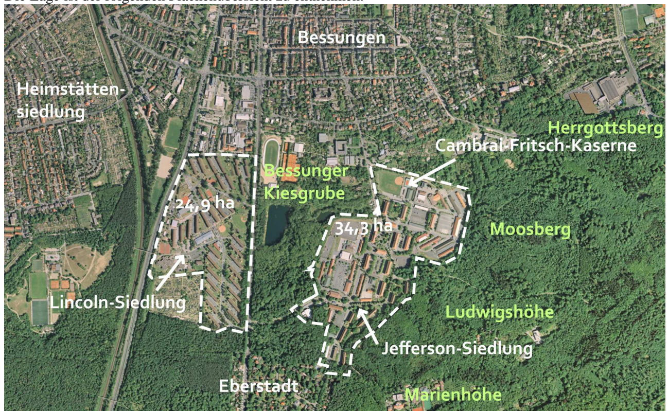
Abbildung 1: Übersicht der Konversionsflächen im Süden von Darmstadt (Grafik: BS+ Städtebau und Architektur)

Die Lage ist der folgenden Flächenübersicht zu entnehmen: